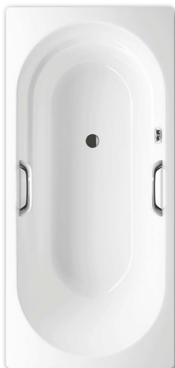
Photo d'exemple VAIO STAR avec poignées

Lors de la commande avec trop-plein opposé veuillez commander la variante xxxx 2300 xxx.