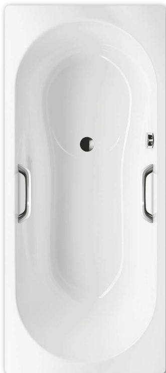
Photo d'exemple VAIO SET STAR avec poignées

Lors de la commande avec trop-plein opposé veuillez commander la variante xxxx 2300 xxxx.