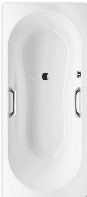
Photo d'exemple VAIO SET STAR avec poignées

Lors de la commande avec trop-plein opposé veuillez commander la variante xxxx 2300 xxxx.