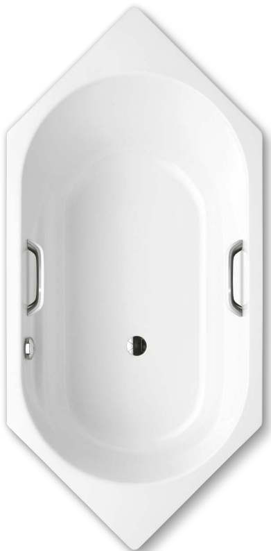
Photo d'exemple VAIO 6 STAR avec poignées

Lors de la commande avec trop-plein opposé veuillez commander la variante xxxx2300xxxx.