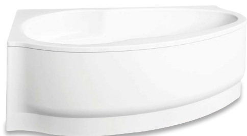
Photo d'exemple STUDIO STAR avec poignées