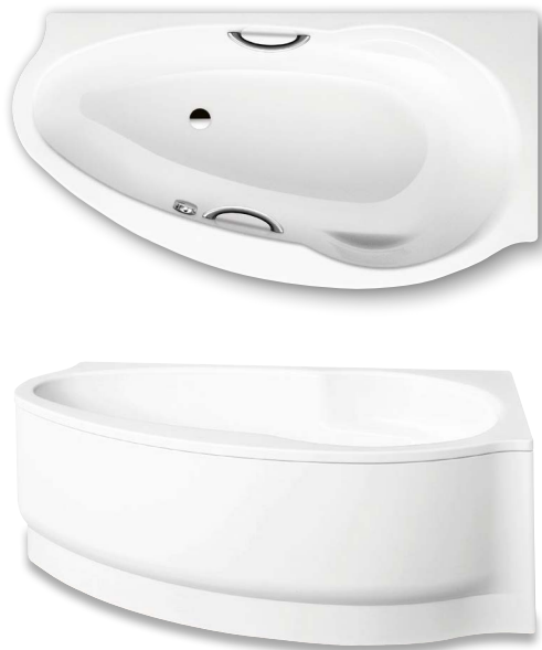
Photo d'exemple STUDIO STAR avec poignées