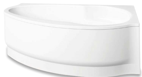
Photo d'exemple STUDIO STAR avec poignées