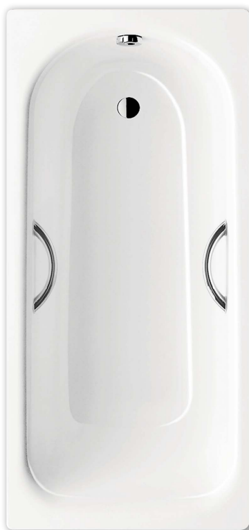
Photo d'exemple SANIFORM PLUS STAR avec poignées