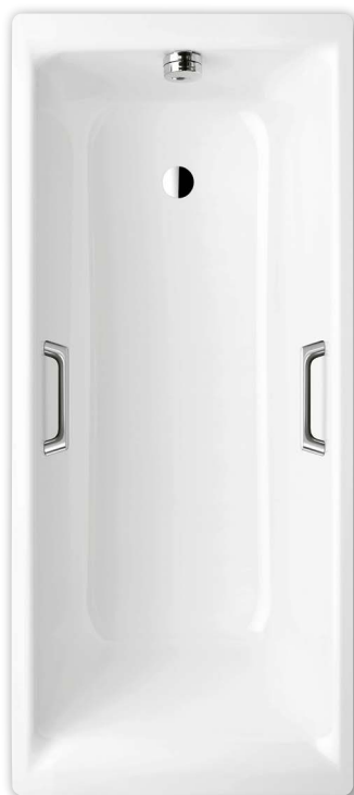
Photo d'exemple PURO STAR avec poignées