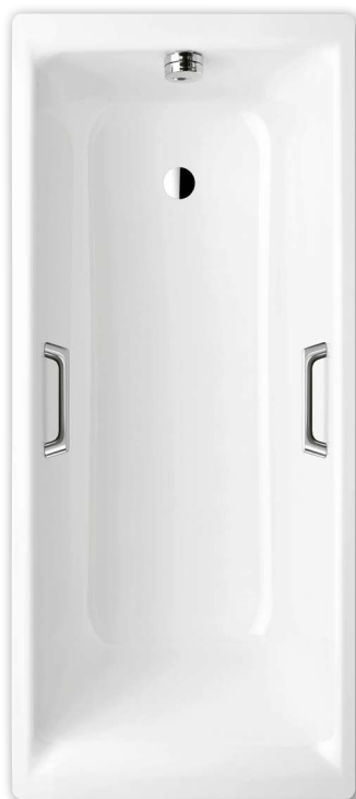
Photo d'exemple PURO STAR avec poignées