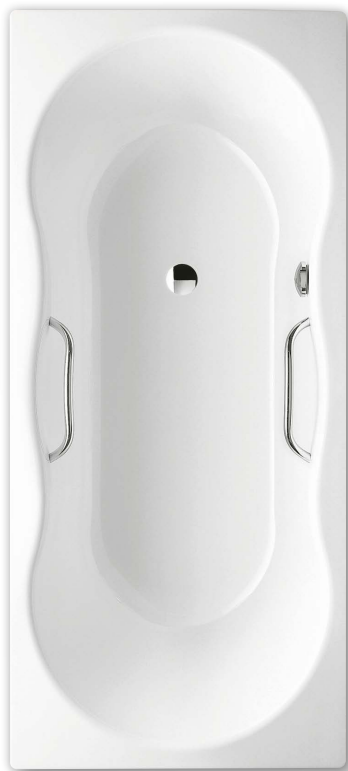
Photo d'exemple NOVOLA STAR avec poignées

Lors de la commande avec trop-plein opposé veuillez commander la variante xxxx 2300 xxxx.