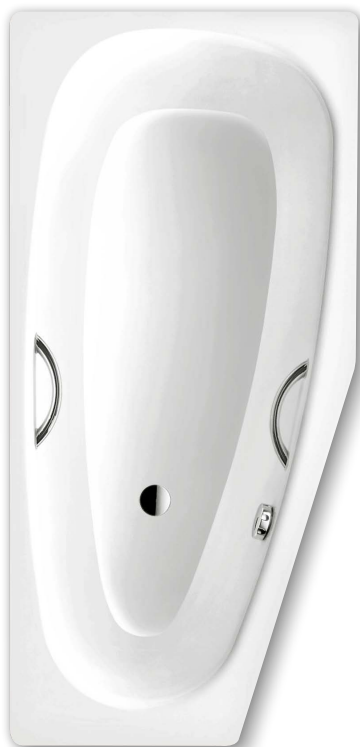
Photo d'exemple MINI STAR à gauche avec poignées