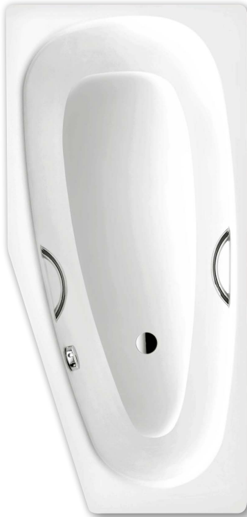
Photo d'exemple MINI STAR à droite avec poignées