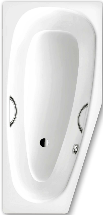
Photo d'exemple MINI STAR à gauche avec poignées